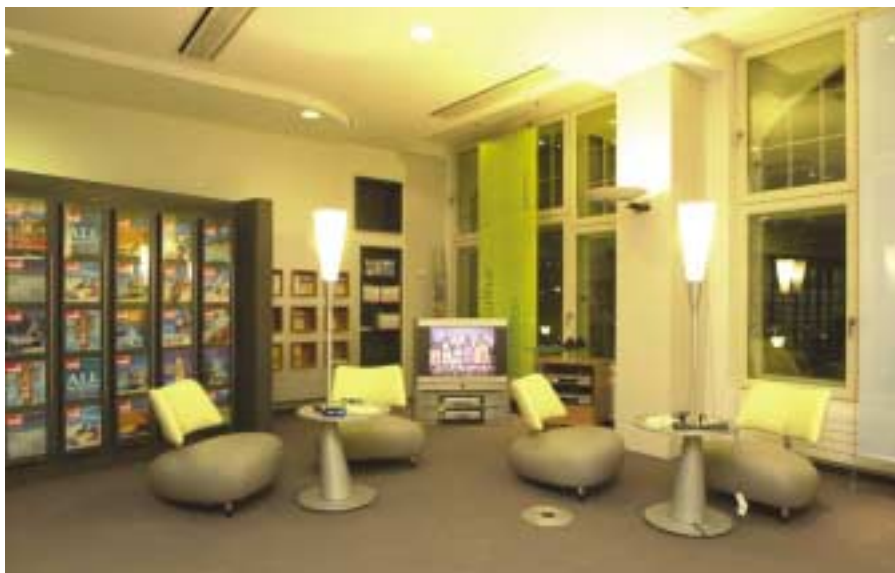
Nicht selten verweilen Kunden zwei bis drei Stunden im neuen Reiseerlebnis-Center in Berlin.