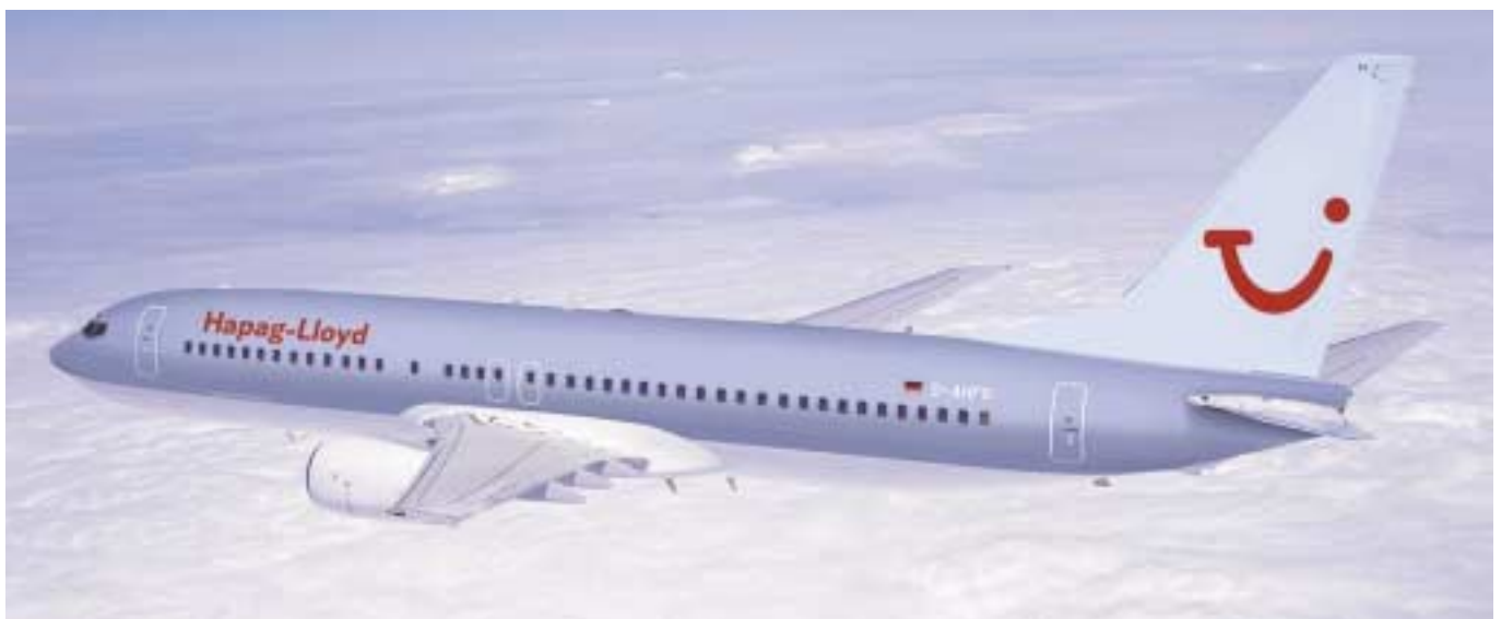
Auf der neu gestalteten Flugzeugflotte wird die neue Dachmarkenstrategie der Preussag sehr gut sichtbar.

Vor Logos, Symbolen, Visionen und Markenbildung stand damals zunächst die Schaffung eines über die gesamte Wertschöpfungskette liegenden Produkt- und Servicekonzepts im Bereich Reisedienstleistungen. Das Touristikunternehmen investierte massiv in die Qualität seiner Produkte und fing an, den Kern der Reisedienstleistung, nämlich die Hotels in den Zielgebieten selbst, genauestens unter die Lupe zu nehmen. Hohe Anforderungen an Hotel, Ausstattung und Service stecken auch heute noch den Rahmen, in dem sich Reiseziele bewegen müssen, um ins Portfolio der Hannover-